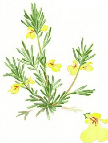
Aquarelle de Richard Mongenet