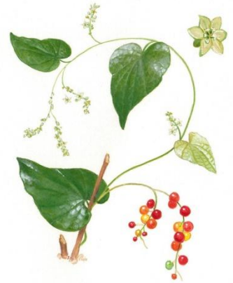
Aquarelle de Richard Mongenet