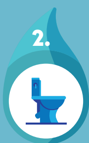
sacs économiseurs pour les toilettes