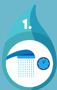
limiteurs de débit pour les douches

des dispositifs hydro-économiques* GRATUITS