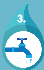
mousseurs pour les robinets