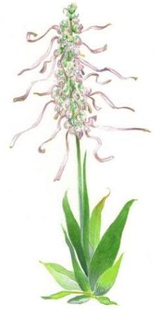
Aquarelle de Richard Mongenet