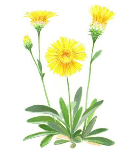
Aquarelle de Richard Mongenet