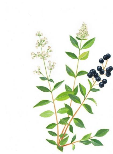
Aquarelle de Richard Mongenet