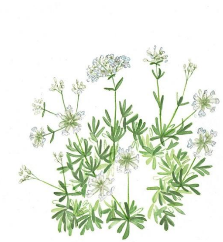
Aquarelle de Richard Mongenet