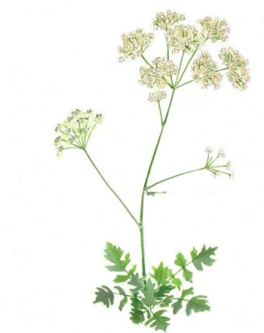
Aquarelle de Richard Mongenet