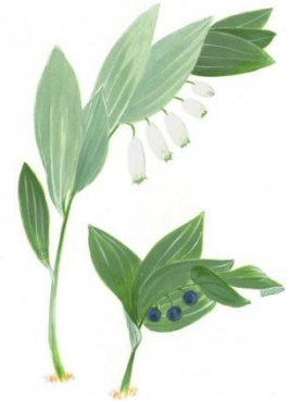
Aquarelle de Richard Mongenet