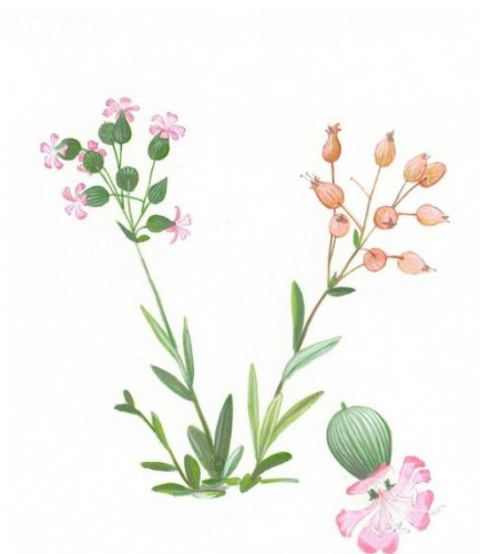
Aquarelle de Richard Mongenet