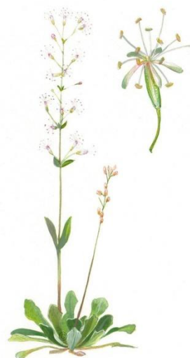
Aquarelle de Richard Mongenet