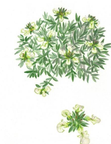
Aquarelle de Richard Mongenet