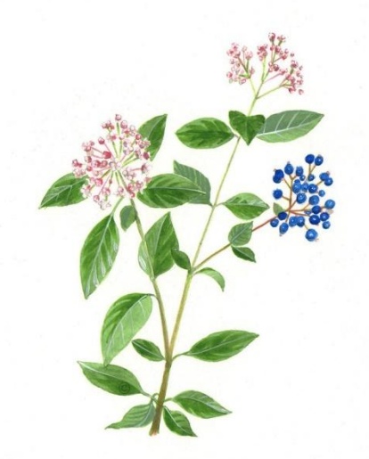
Aquarelle de Richard Mongenet