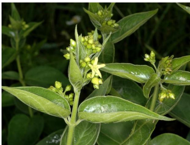
Feuilles et fleurs