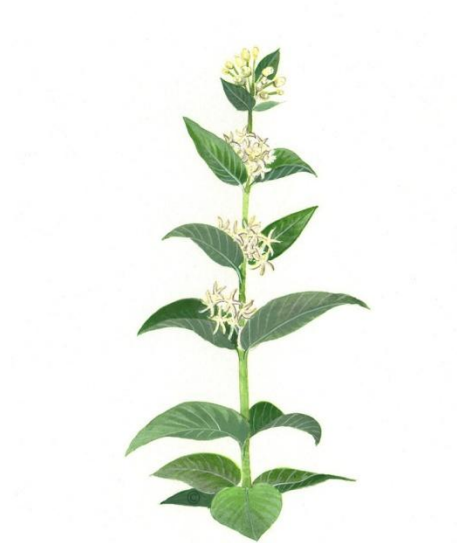
Aquarelle de Richard Mongenet